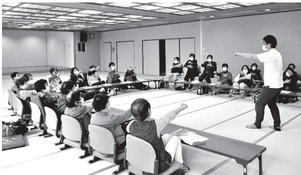
写真は、彼杵中央サロン (4月19日)