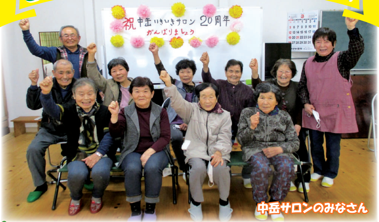
中岳サロンのみなさん