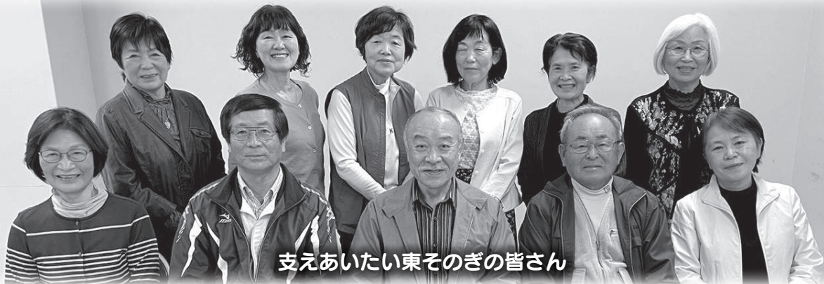
支えあいたい東そのぎの皆さん

三つ葉の会でワンコインボランティアによる生活支援をスタートしました。令和4年度は、ゴミ出しなどを中心に約120件のお手伝いをしました！