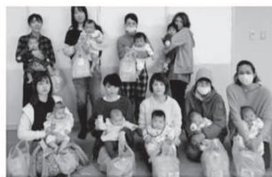
「子育て支援事業」 赤ちゃんのすこやかな成長を願って、 衛生用品を贈ります。