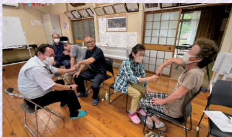
ワラカツの様子「笑いは健康の源」です

8月29日、ふれあいいいききサロンの体験版「出張！井戸端サロン」を一ツ石地区で開催しました。