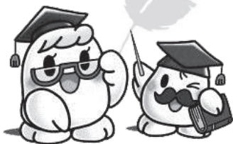
「小中学校の福祉活動への助成」 福祉の学習や環境美化等に 役立てられます。