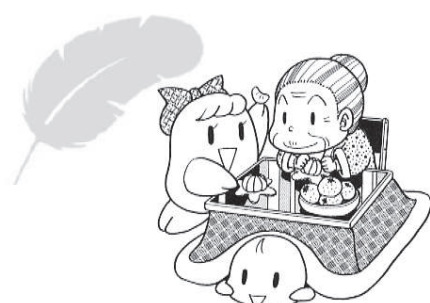
福祉団体、ボランティア団体への 活動助成等