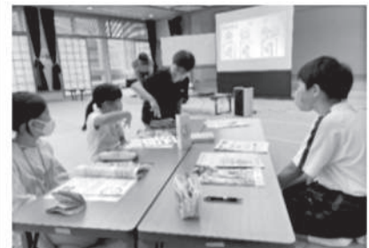
「こどもふくしセミナー」の開催