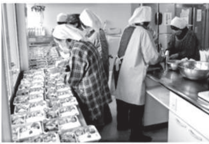
「食事サービス」 安否確認をかねて高齢者へ 手作りのお弁当を届けます