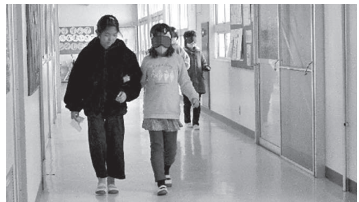
▲アイマスク体験。声かけが重要です。