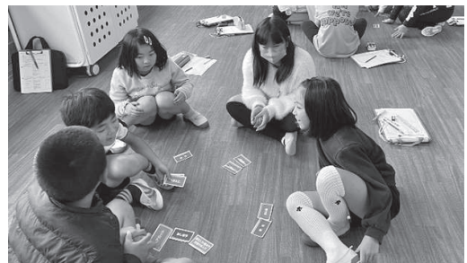
▲支えあい体験カードをする子どもたち

12月には、アイマスク体験を行い、視覚障害の方がどんなことで困っているのか、どんなサポートがあれば助かるのか考え、自分たちにもできることがあることを知りました。また、視覚障害の方が、不便なこともあるが、自分らしく生きていच्छることを紹介し、「その人」を理解することの大切さについて理解しました。今後も、さらに学びを深めてほしいと思います。