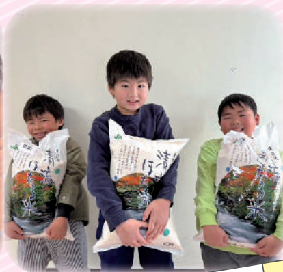
学童保育にこにこハウス