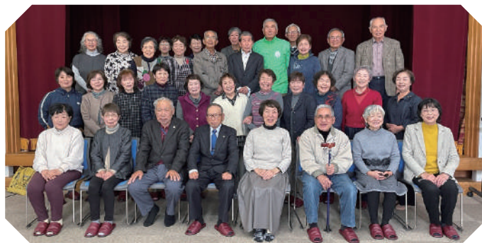
交流会に参加した平戸市、東彼杵町サロンのみなさん。 これからも「気軽に・楽しく」サロンを続けていきましょうね。