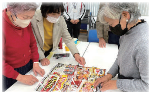
平戸市のサロンで人気の「手作り広告パズル」。 ああじゃない、こうじゃないと皆で大笑い。 とっても盛り上がりましたよ。

東彼杵町ふれあいいきいきサロン連絡協議会は、役員研修として平戸市ふれあいサロン連絡会との意見交換会を行いました。各町のサロンの取り組みを紹介した後、グループに分かれ「私の地区のサロン自慢」や、「会員獲得に向けた取組」などについて活発に意見を交わしました。悩みを共有し、互いの活動を参考にしながらますます活動が発展していくことでしょう。これからも、交流を続けていきたいと思います。