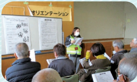
▲オリエンテーションでは、活動中の注意点について説明を行います。