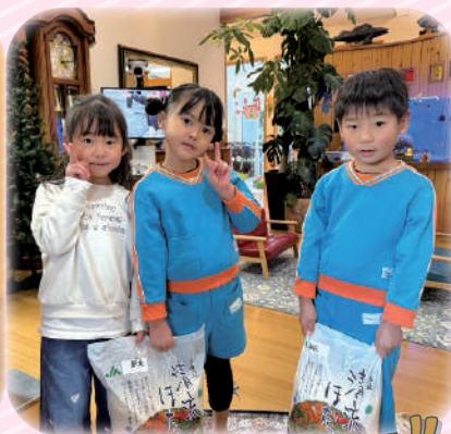
やまだこどもえん